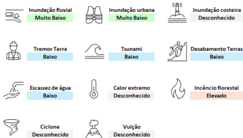
Figura 13 | Classificação de probabilidades para os perigos físicos identificados – Porto

Ao nível da unidade do Porto (relevância: pouco relevante), temos a seguinte classificação de probabilidade para os perigos físicos identificados: