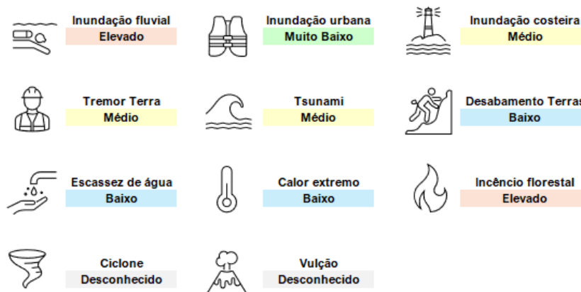
Figura 12 | Classificação de probabilidades para os perigos físicos identificados – Faro

Ao nível da unidade de Faro (relevância: pouco relevante), temos a seguinte classificação de probabilidade para os perigos físicos identificados: