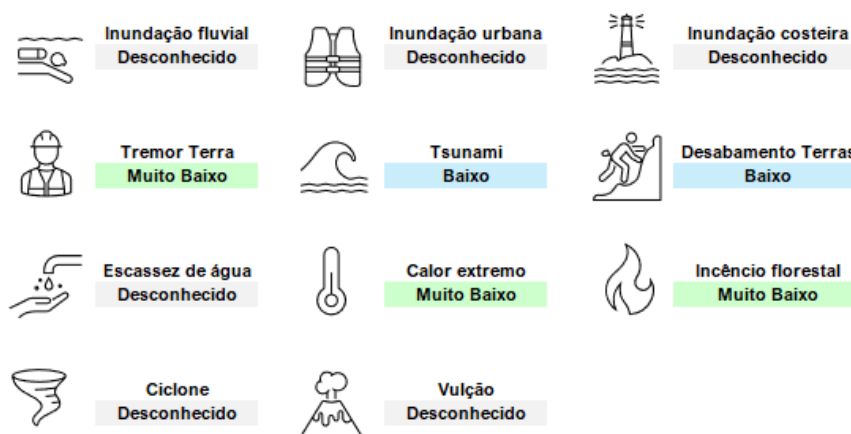
Figura 14 | Classificação de probabilidades para os perigos físicos identificados – Funchal

Ao nível da unidade do Funchal (relevância: pouco relevante), temos a seguinte classificação de probabilidade para os perigos físicos identificados: