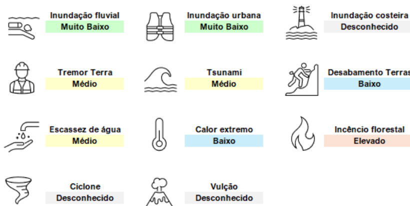
Figura 11 | Classificação de probabilidades para os perigos físicos identificados – Lisboa

Ao nível da unidade de Lisboa – sede e armazém (relevância: crítico), temos a seguinte classificação de probabilidade para os perigos físicos identificados: